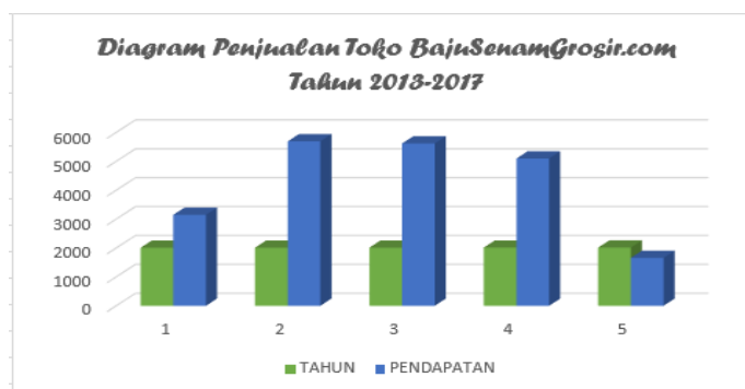
Gambar 1. Volume penjualan Toko BajuSenmGrosir.com tahun 2013-2017

Meningkatnya perkembangan perekonomian di Indonesia saat ini membuat persaingan bisnis yang dihadapi perusahaan menjadi semakin ketat, sehingga menuntut manajemen harus lebih cermat dalam menentukan strategi bersaing agar dapat memenangkan persaingan yang dihadapi perusahaan. Seiring dengan dinamika dan meningkatnya aktivitas masyarakat yang menginginkan kecepatan dan kemudahan dalam segala hal termasuk berbelanja, maka upaya-upaya untuk memuaskan kebutuhan konsumen perlu dilakukan oleh setiap perusahaan dengan berbagai strategi dengan harapan konsumen akan merasa puas terhadap produk dan layanan perusahaan serta berkeinginan untuk melakukan pembelian ulang.